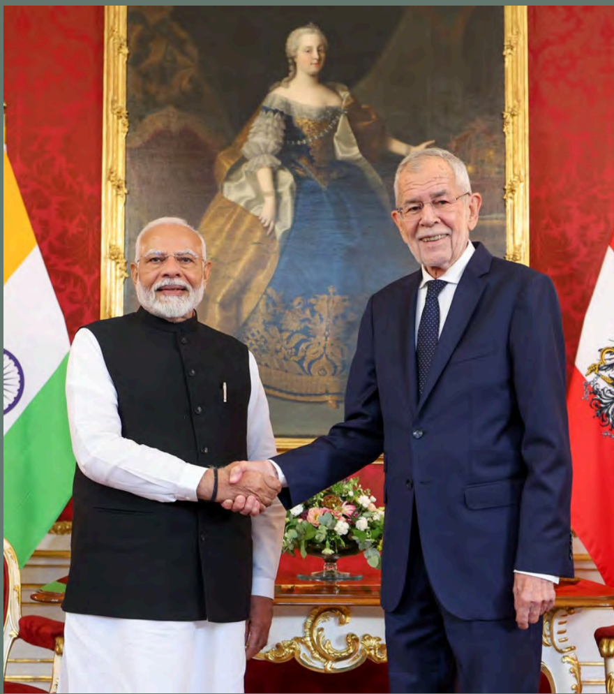
Der indische Premierminister Narendra Modi raf den österreichischen Bundespräsidenten Alexander Van der Bellen

Der Besuch von Premierminister Narendra Modi in Österreich war ein historisches Ereignis, denn es war der erste Besuch eines indischen Premierministers in diesem Land seit 41 Jahren. Der Besuch markierte auch den 75. Jahrestag der Aufnahme diplomatischer Beziehungen zwischen Indien und Österreich, was die langjährige Beziehung zwischen den beiden Ländern unterstreicht.