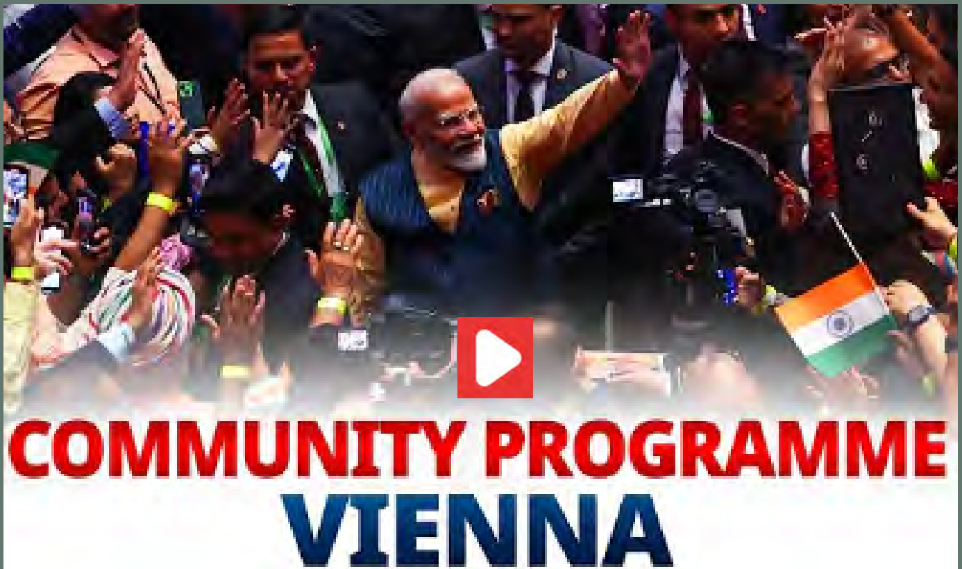
Premierminister Narendra Modi spricht vor der indischen Diaspora in Wien