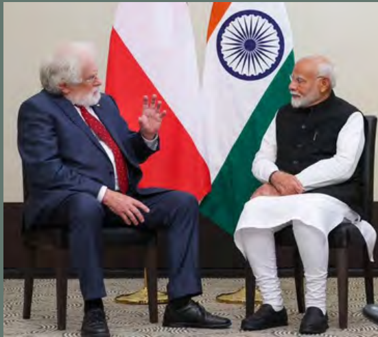
Premierminister Narendra Modi traf den renommierten österreichischen Physiker und Nobelpreisträger Anton Zeilinger in Wien.